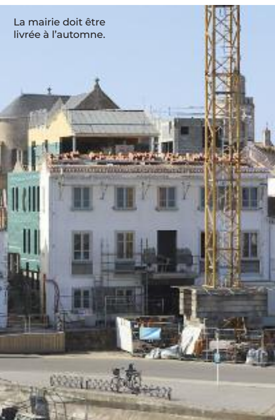
La mairie doit être livrée à l'automne.

Le 20 octobre dernier, le conseil municipal a décidé à l'unanimité de répondre à l'appel aux dons lancé par l'Association des maires ruraux des Alpes-Maritimes suite à la tempête Alex qui a frappé les vallées de La Vésubie, de la Tinée et de la Roya. La mairie a donc accordé un don évalué symboliquement à 1 euro par habitant, soit 5000 euros, afin de venir en aide aux communes sinistrées.