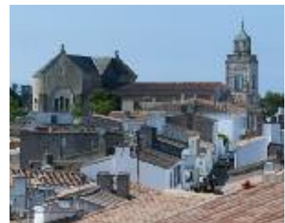
La toiture de l'église de Port-Joinville va être refaite cette année.

"Tous ces travaux sont très subventionnés, précise Michel Bourgerly. Cela limite l'endettement de la commune à un niveau très raisonnable avec un ratio de désendettement qui reste autour de cinq ans." Autre élément positif, le fait que quasiment tous les foyers islais (2000 sur les 2300 assu-