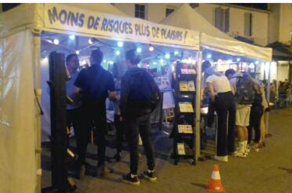
Les stands de prévention seront ouverts sur deux dates cet été.