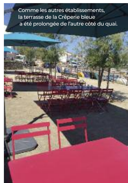
Comme les autres établissements, la terrasse de la Crêperie bleue a été prolongée de l’autre côté du quai.