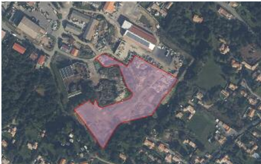
Périmètre d'extension de la ZA de la Marèche.