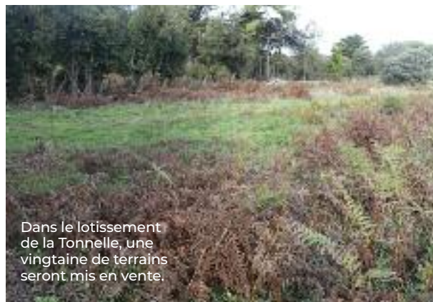
Dans le lotissement de la Tonnelle, une vingtaine de terrains seront mis en vente.

La commune définit de nouvelles règles pour l'attribution des terrains aux primo-accédants. L'objectif est toujours de faciliter l'accès des Islaïis au logement.