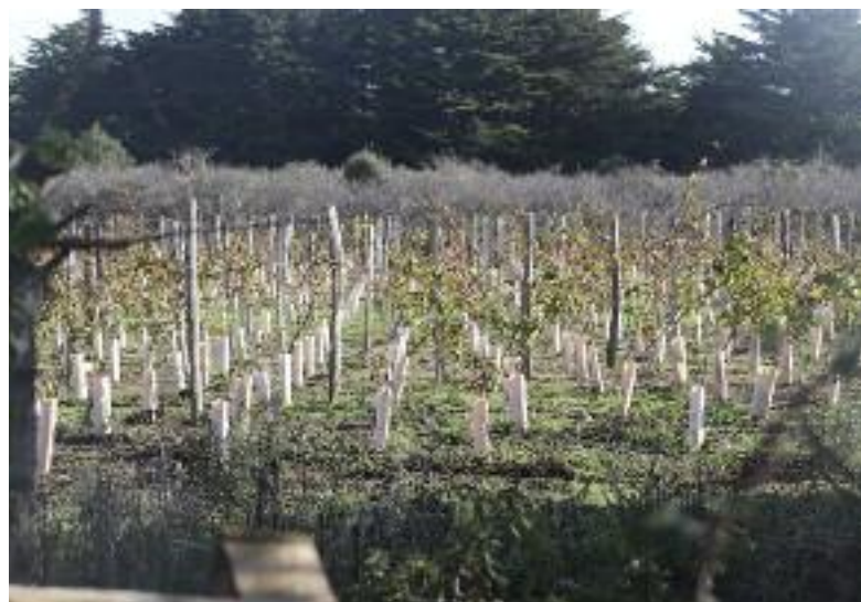
Une parcelle de vignes a été plantée en chenin au printemps 2021 près du Grand Phare.

depuis les inscriptions en ligne en 2016, nous perdions le contact avec les demandeurs d'emploi et nous avons des difficultés à répondre aux demandes des entreprises. Nous avons donc convenu que désormais, à toute première inscription, l'entretien par téléphone ou visio se ferait depuis le Relais Emploi de l'île d'Yeu. Cela permet de recréer le lien, de mieux guider les demandeurs dans leur recherche et de les mettre en relation avec les entreprises. Dans un autre domaine, nous avons également la résidence Les Patagos à Saint-Sauveur pour loger les saisonniers. Elle va ouvrir d'avril à la Toussaint en 2023 pour les saisonniers de haute saison.