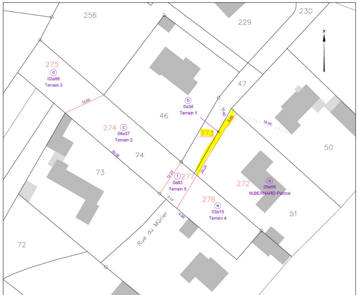
Extrait du document d'arpentage