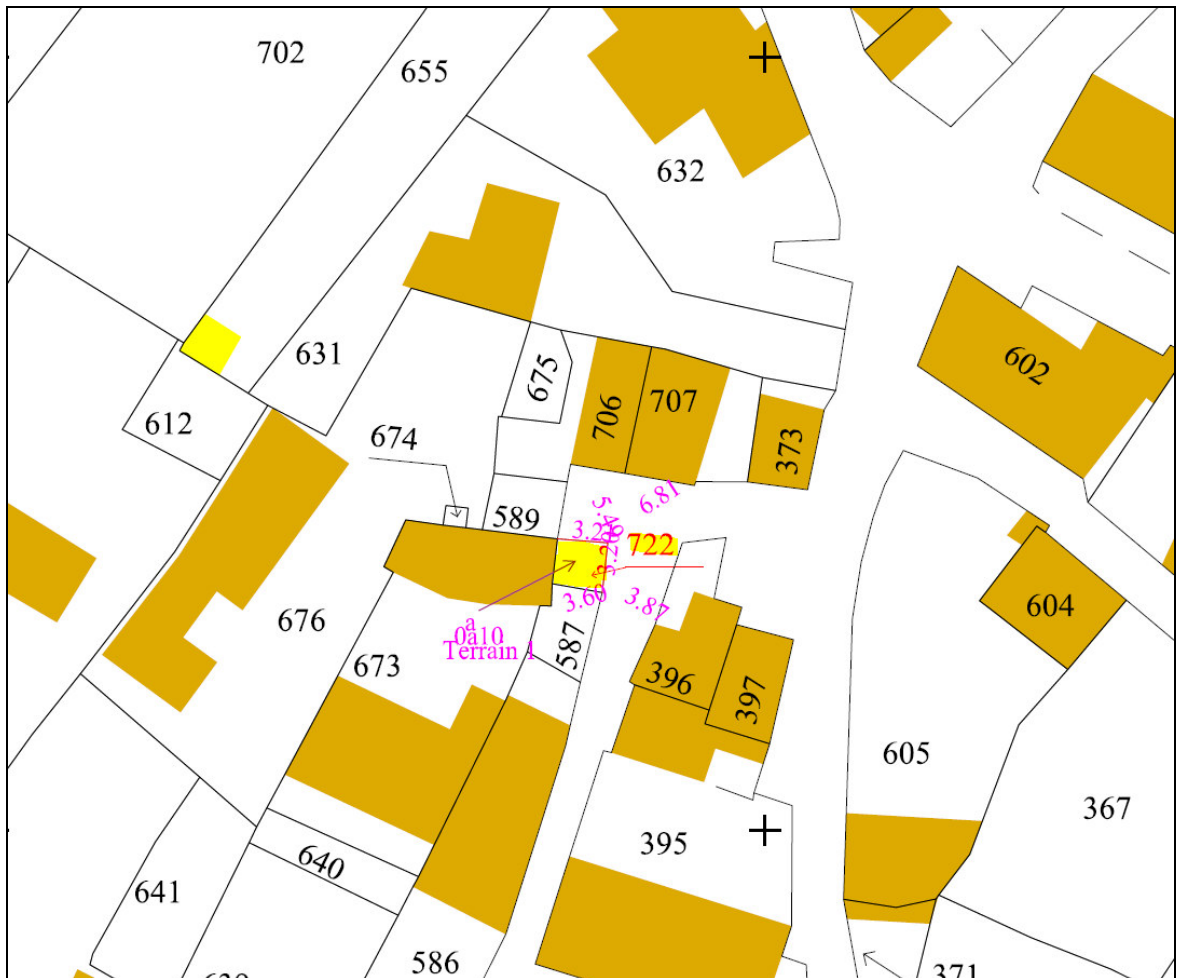
Plan 2 - Extrait du document d'arpentage numéroté