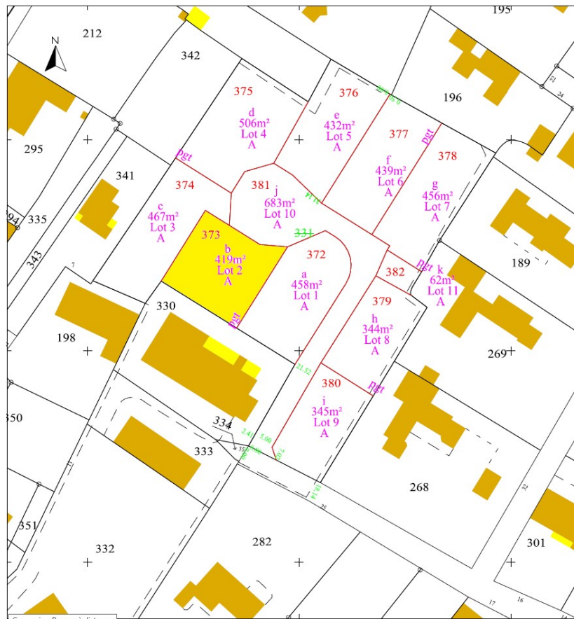
Plan cadastral à jour