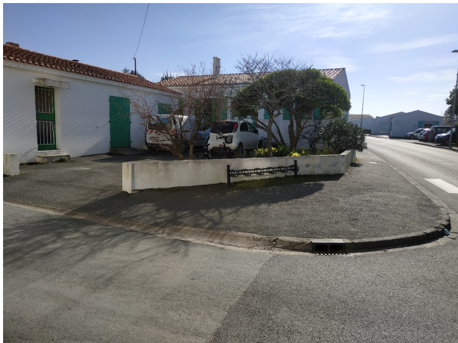
Photographie des bâtiments

La Commune, en 2023, a décidé de mettre en vente les bâtiments situés rue de la Victoire.