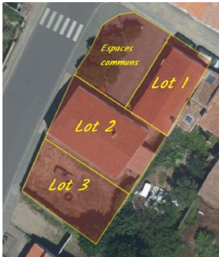
Plan des lots commercialisés

Il était aussi décidé que les espaces communs seraient partagés en fonction des attentes/besoins des candidats retenus.