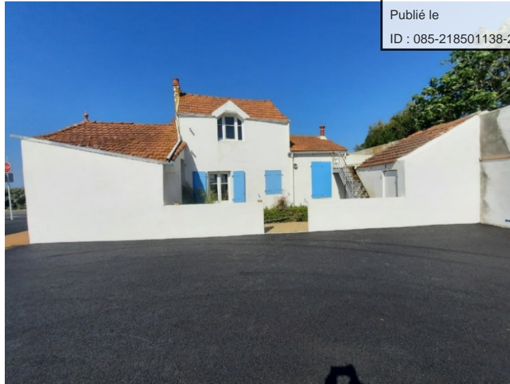
Photographie du bâtiment (vue depuis le parking Neptune)

L'immeuble est composé comme suit ( il est précisé que les pièces sont totalement vides aujourd'hui. Le détail qui suit est l'état des lieux de 2020 ) :