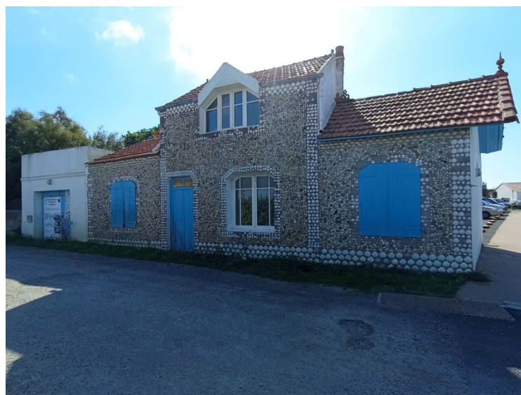
Photographie du bâtiment (vue depuis la rue de la Plage)

La Commune, en 2024, a décidé de mettre en vente le bâtiment situé au 32 rue de la PLAGE (appelé Maison aux Coquillages ).