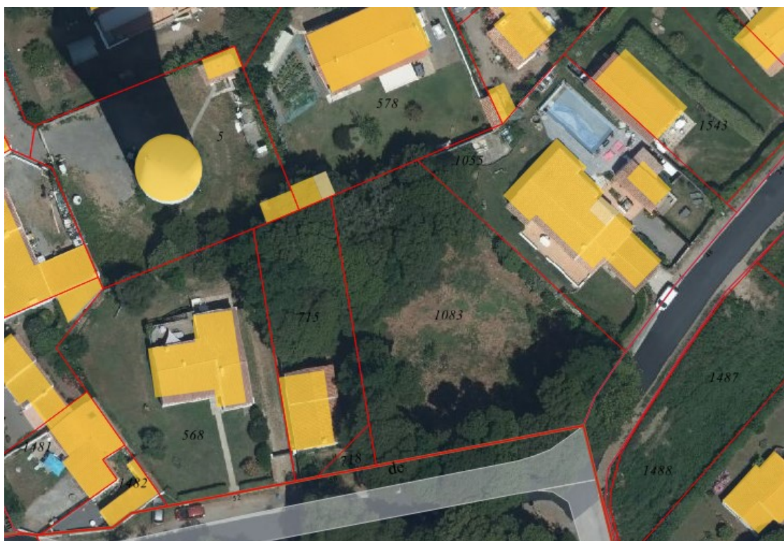
Extrait photographie aérienne (PCRS juillet 2022) + plan cadastral

M. et Mme ARCHAMBEAU sont propriétaires d'une parcelle située à la Citadelle : parcelle référencée 113 AM 1083 (1104m 2 ).