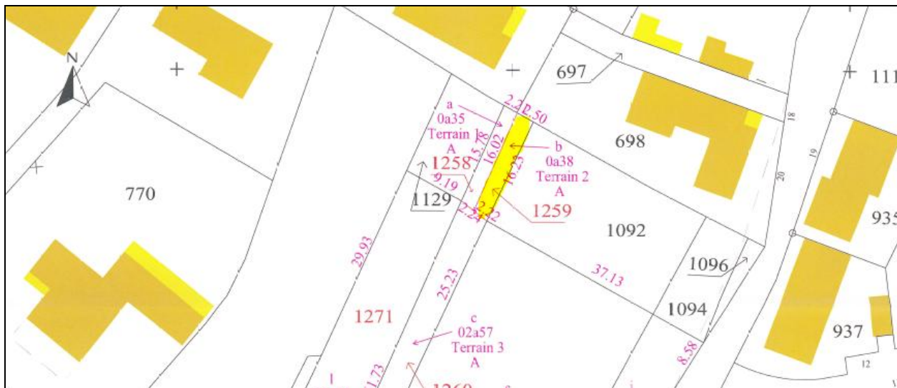
Extrait du document d'arpenteage