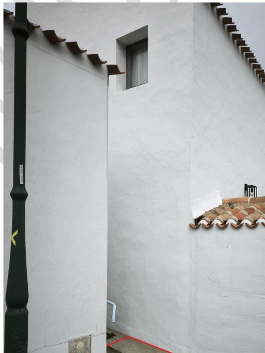
Extrait photographique illustrant l'alignement