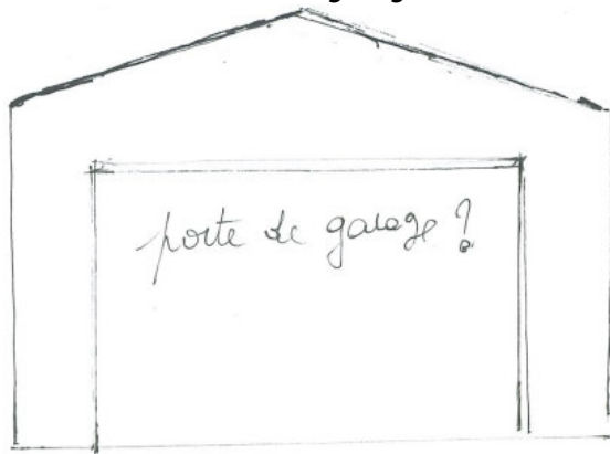
Quid des garages