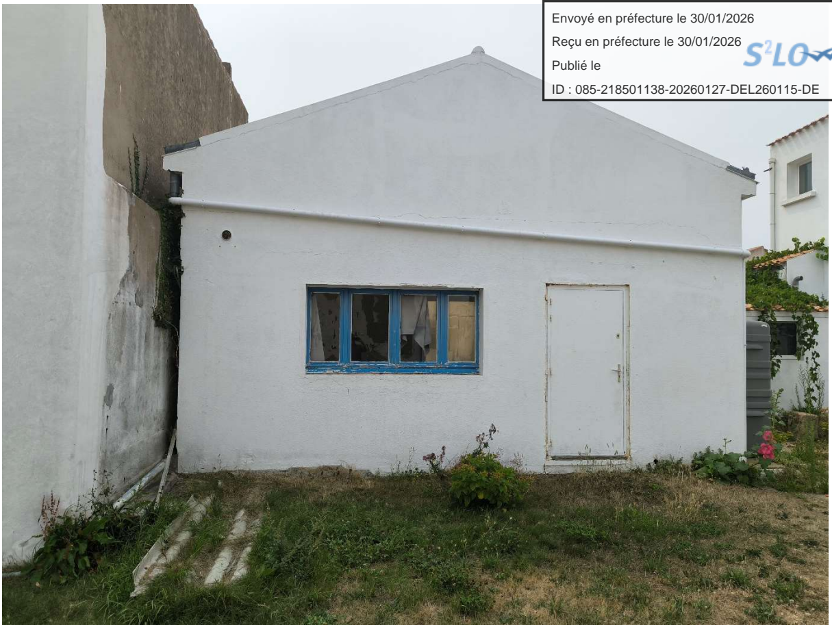
Photographie de l'ancien atelier de stockage des objets patrimoniaux