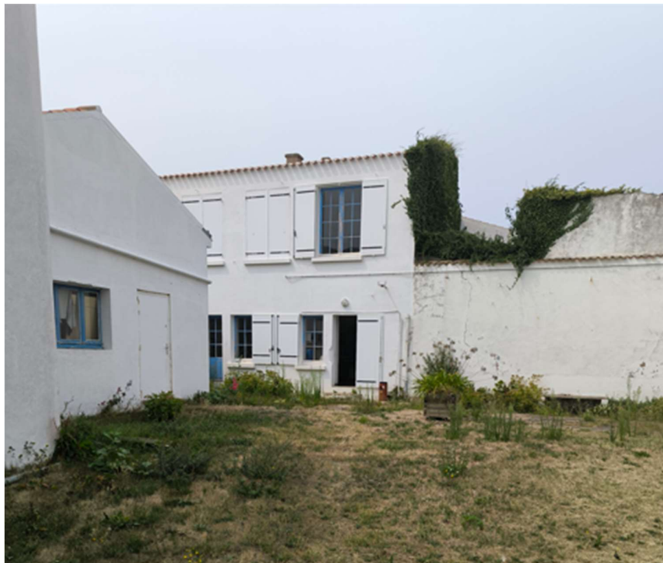
Photographie des bâtiments (vue depuis la ruelle d'accès)